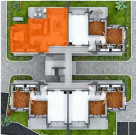
BİRİNCİ KAT PLANI